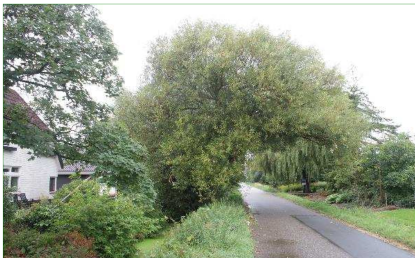
De grote wilg aan de straatzijde staat op de plek waar een nieuwe oprit gerealiseerd zal worden en het plan is daarom om deze te kappen.