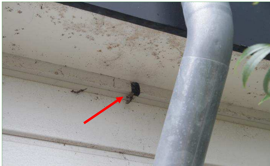
Op twee plaatsen zitten er gaten in de houten daklijsten. Deze gaten kunnen mogelijk toegang geven tot verblijfplaatsen van vleermuizen.

De manier waarop vleermuizen een gebied gebruiken kan door het jaar verschillen, een gebouw of een boom kan bijvoorbeeld tijdelijk gebruikt worden als verblijfplaats maar in andere delen van het jaar ongebruikt blijven.