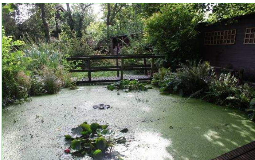
De vijver in de achtertuin dient te worden gedempt om de nieuwe woonkavels te realiseren.