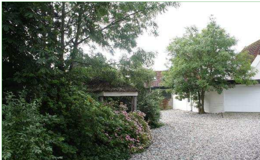
Rond de bebouwing is de grond grotendeels bestraat en met kiezels belegd. Langs de randen van het planperceel staan kleine groenstroken.