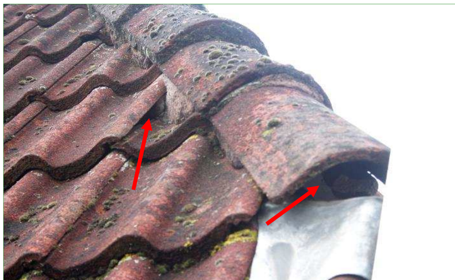
De spleten tussen dakpannen kunnen potentieel toegang geven tot verblijfplaatsen voor vleermuizen.